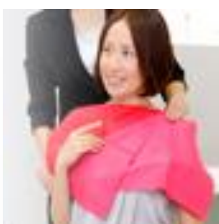
〈パーソナルカラー〉