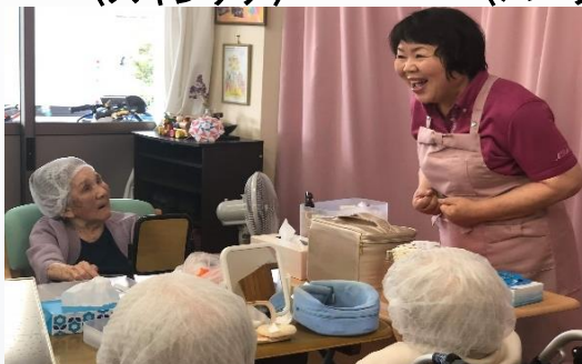
〈化粧療法レクリエーション〉